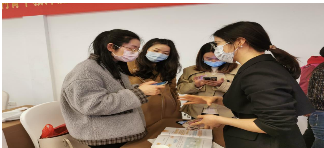
老师们真诚交流，传经送宝。