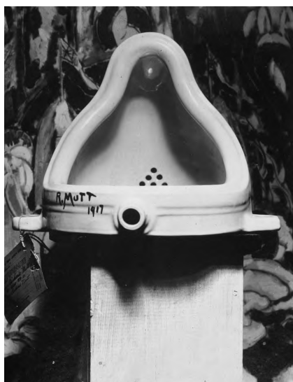
图2 杜尚的《泉》和《自行车轮》