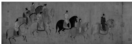
(唐)张萱《虢国夫人游春图》,辽宁省博物馆藏

“作为审美对象的身体”教学设计 教师分析理论和具体现象,学生针对不同的身体审美现象的案例展开自由讨论,完成“研讨内容”,形成自我的身体审美认知。