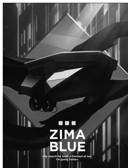
图3 雷诺兹的《齐马蓝》